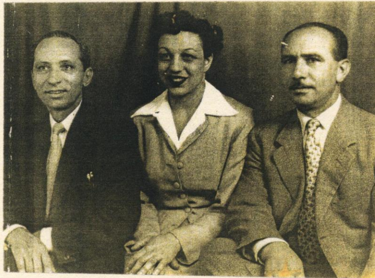
Ο θανάσιος Η Νίρα Ο μικρός αδερφός Αμερική 1954